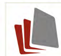
适合多种扫描应用