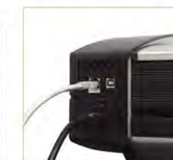
内网最高35.56cm/s彩色扫描传输