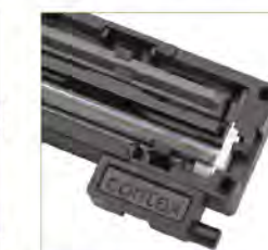
Contex 双光源双扩散 CIS