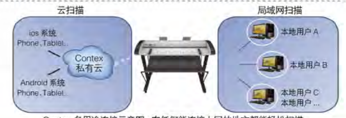
Contex 多用途连接示意图:在任何能连接上网的地方都能轻松扫描

最新 Contex IQ Quattro 系列工程扫描仪是目前行业内唯一支持私有云扫描服务的大幅面设备,扫描仪无需连接计算机,您只需要通过智能 iOS 或安卓系统,就可以在手持设备上扫描、查看图像,让您的工作快速便捷。同时,Nextimage 支持 Contex 扫描仪的本地网络功能,允许您在局域网内通过网络控制、操作扫描仪,建议使用千兆以太网。