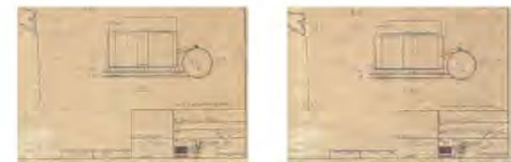
IQ Quattro 4400